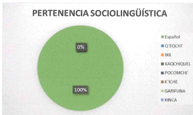
Según la anterior gráfica, el 100% de las personas atendidas tiene una pertenencia sociolingüística al idioma español